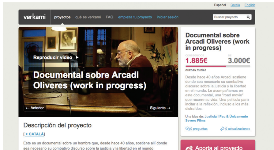
Els responsables del film han optat pel micromecenatge a través d'Internet.